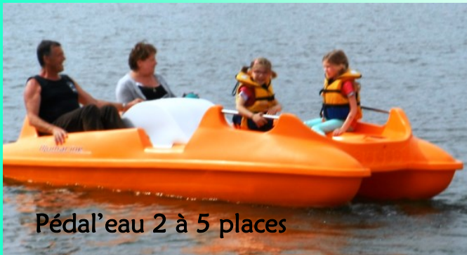
Pédal'eau 2 à 5 places