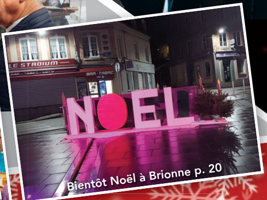
Bientôt Noël à Brionne p. 20