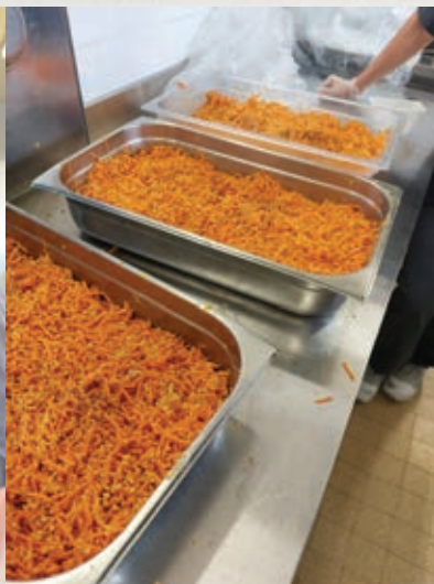
parent le repas des enfants dans la cuisine centrale