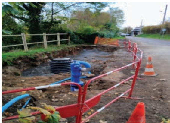
● 1 ère cuve enterrée face au 28 rue des Essarts

Promenade de la Risle , installation d'un puisard dans la rivière. En effet, après avoir fait des relevés de niveau d'eau, cette solution a pu être déployée ●