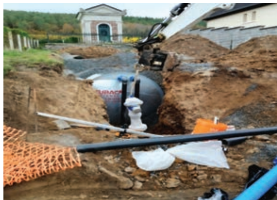
● 2 ème cuve enterrée rue des Essarts