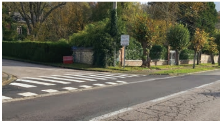
● Passage piéton boulevard de la République