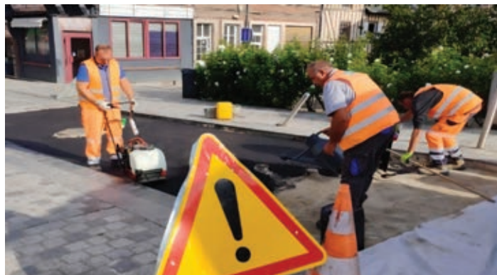
● Travaux rue Foch

Dans le cadre de l'opération de sécurité de la rue de la Cabotière, une subvention du Département de l'Eure, au titre des amendes de police, a été obtenue pour un montant de 10 550 € ●