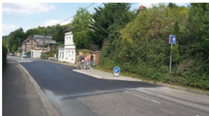
● Travaux rue Lemarrois