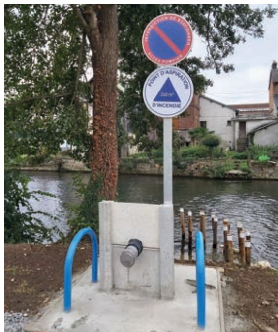
● Puisard promenade de la Risle