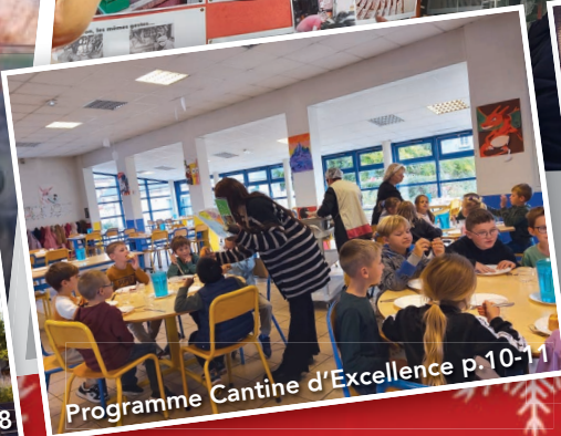
Programme Cantine d'Excellence p.10-11