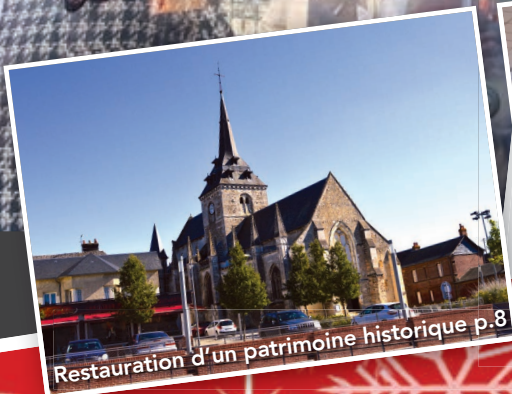
Restauration d'un patrimoine historique p.8