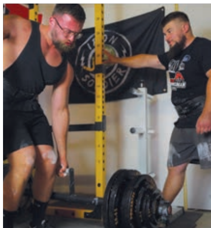
● Séance de strongman sous l'œil du coach.

des événements permettront de financer la participation des membres à diverses compétitions en 2026 : trajets, hébergements, repas et frais d'inscription. Une belle initiative locale qui met en avant la force, la passion et la solidarité d'une nouvelle génération d'athlètes normands ●